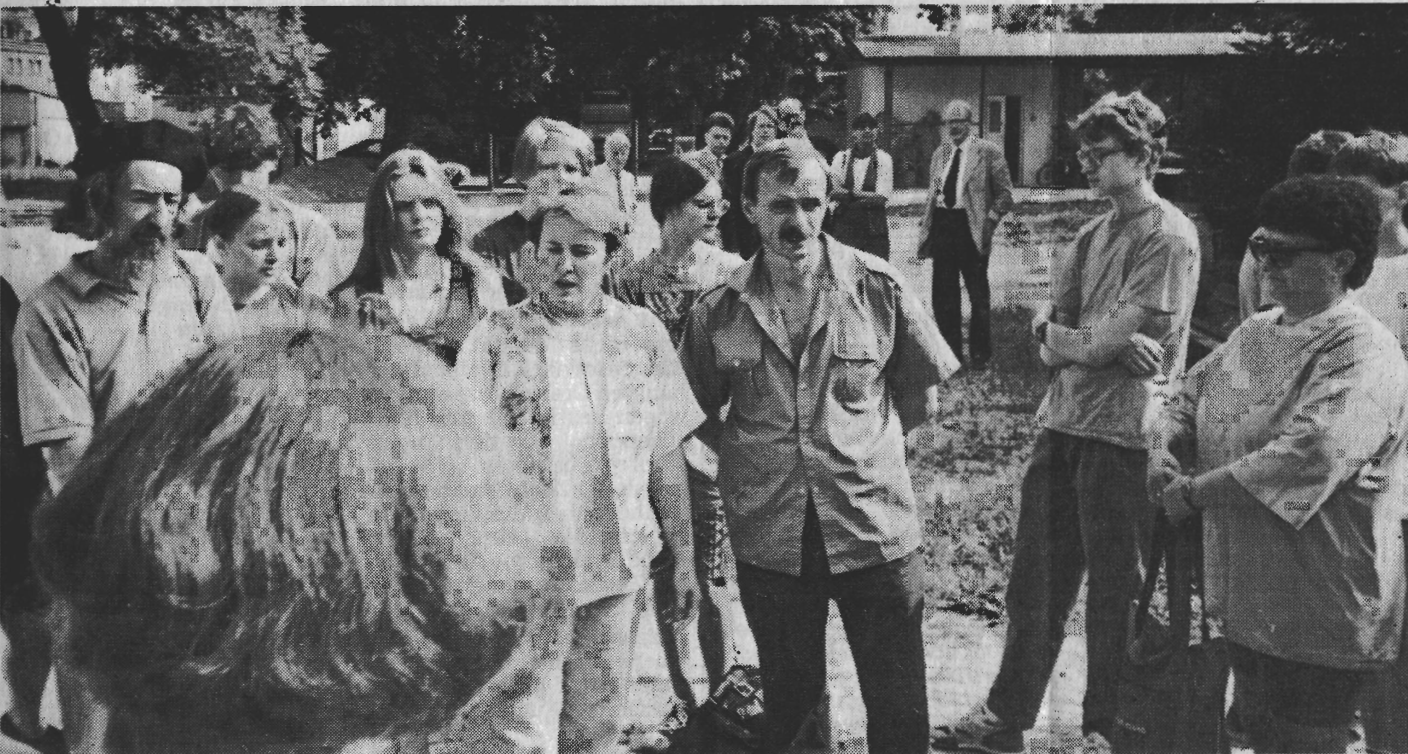
Die Direktorin des Historischen Museums und der Friedhofswärter weisen die Projektgruppe in die Arbeit auf dem Friedhof ein.