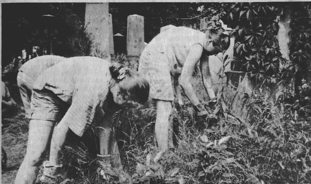
Motiviert: Nina und Silke sicheln meterhohes Gras zwischen den Grabsteinen.