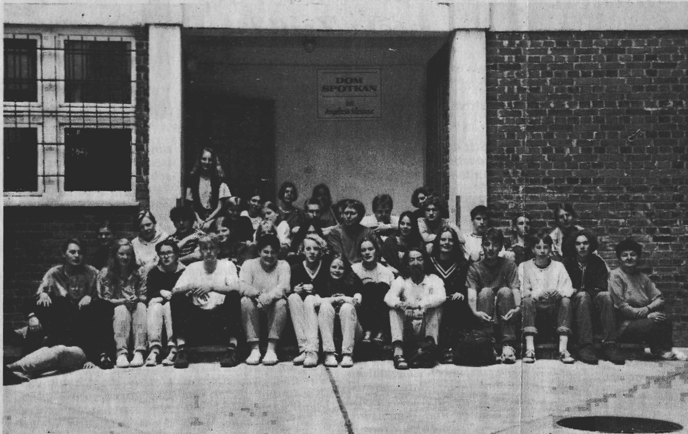
Die 36 Schülerinnen und Schüler der Klassen 10 a und 10 e und weitere Teilnehmer vor dem „Dom Spotkan“, unserer Herberge in Breslau.

Die Eindrücke und Erlebnisse über eine Projektfahrt zu jüdischen Friedhöfen nach Polen