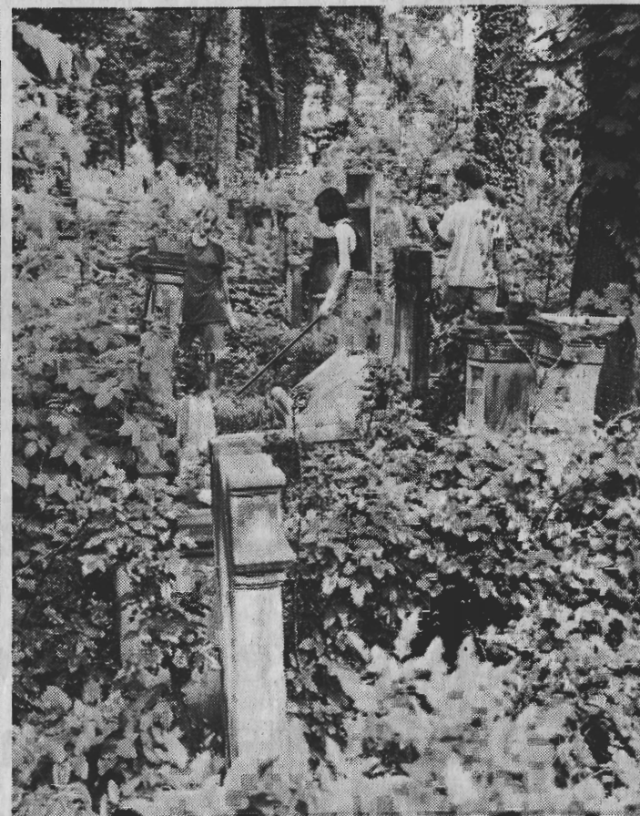
Die Schüler bei ihrer Projekt-Arbeit.